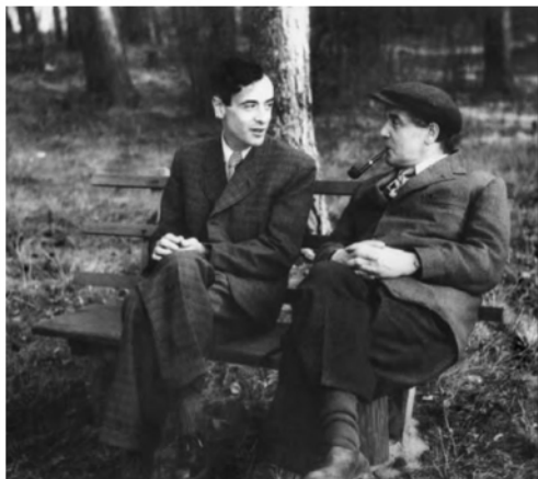
图4 朗道和卡皮查(1948年)

些勇于承担责任、坚持真理的科学家,为他撑起保护伞,尽量发挥他的聪明才智。这不能不说是苏联物理学界的一件幸事。