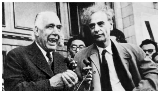
图2 玻尔和朗道在莫斯科大学(1961年)

1929年21岁的朗道被派往国外一年半,访问了丹麦、英国和瑞士,特别是哥本哈根尼尔斯·玻尔领导的研究所。玻尔很赏识年轻的朗道,朗道也把玻尔视为自己的老师。在以后数十年里,他们还多有交往。这次访问期间,他发展了金属电子的“朗道抗磁”理论,从“泡利顺磁”分走了三分之一。电子在磁场中的“朗道能级”以及能级的态密度,这些在后来的量子霍尔效应理论中使用的基本概念,都首次出现在这篇文章里。